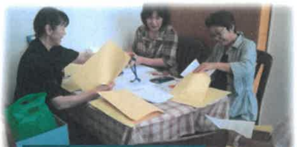
P&Aいしかり世話人会