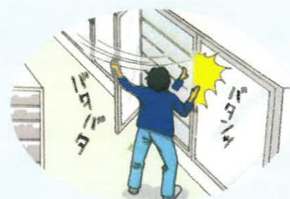
冷蔵庫の扉を開けたり閉めたり