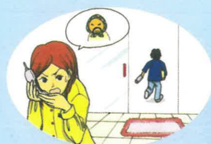
お金を払わずに持って帰ったり