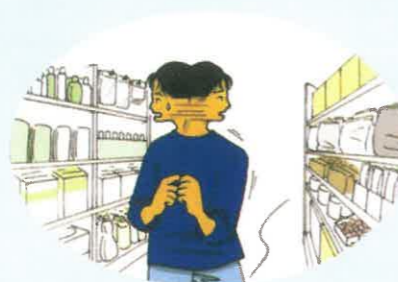
キョロキョロしたり