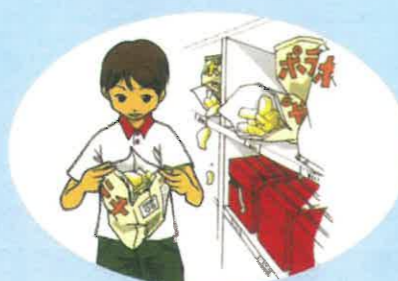
袋を開けて食べたり