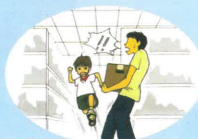
店内を飛び回ったり