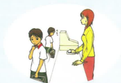
レジ前でもじもじしたり