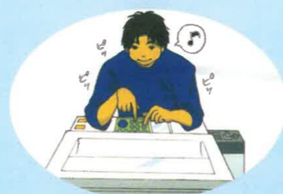
コピー機で遊んだり