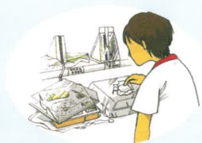
乱暴にさわったり並べ変えたり