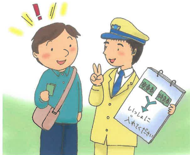
ぽっぽやプロジェクト P&A 大阪